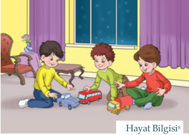
Hayat Bilgisi 8