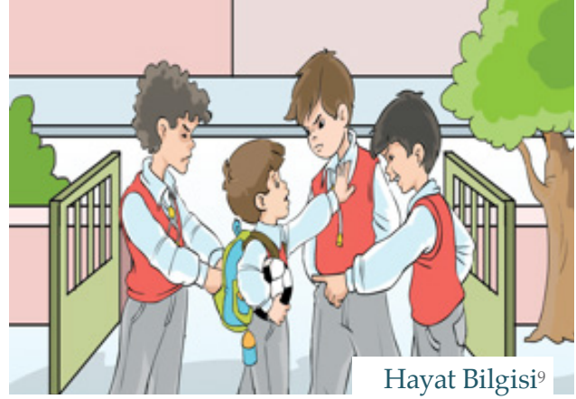
Hayat Bilgisi 9